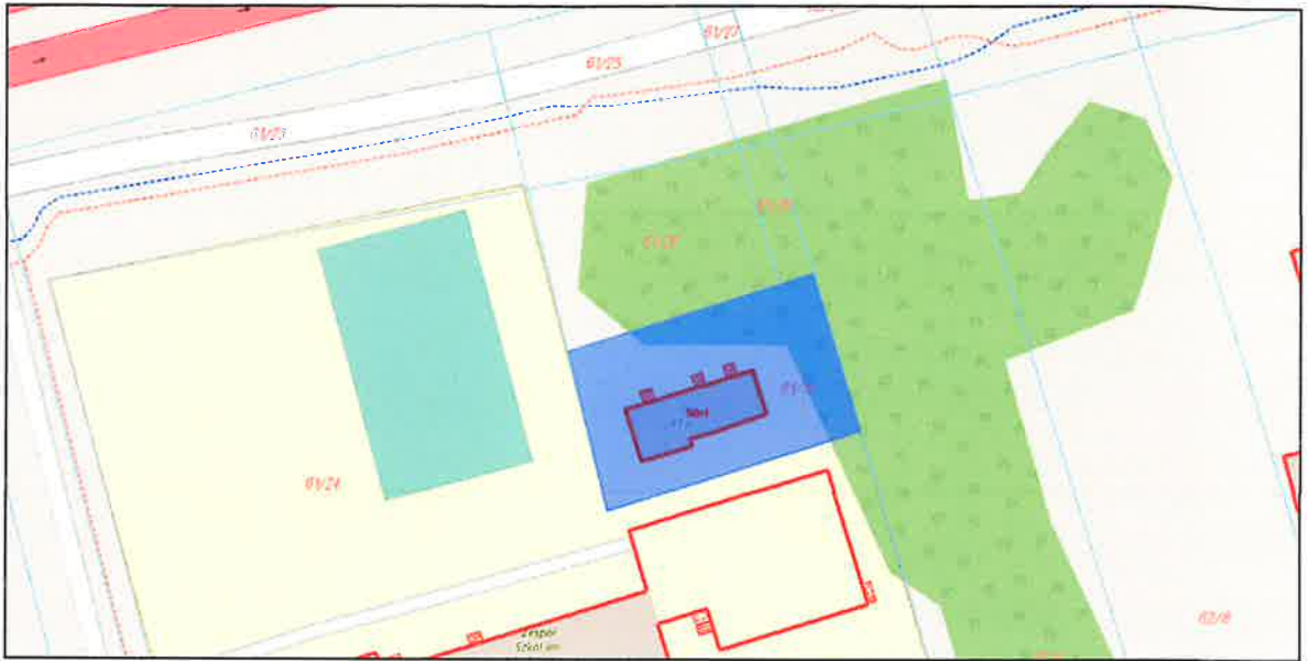
Rys. 2. Kształt i usytuowanie szczegółowe działki nr 61/15